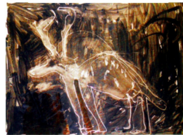
"das Tier" (2), Mischtechnik auf Papier, 50x70cm

1951 geboren in Markranstädt 1970-75 Studium Malerei an der HfBK Dresden bei Diplom bei Prof. Jutta Damme seit 1975 freiberuflich als Malerin, Grafikerin, Objektkünstlerin in Dresden 1989 Gründungsmitglied der „Dresdner Sezession 89“ seit 1991 Aufbau und Leitung der kreativen Werkstatt Dresden e.V. Bau von überdimensionalen Papierobjekten, Aufbau der Siebdruckwerkstatt, Freibrandofenbau, Installationen und Geräuschinstallationen, Organisation von Kunstprojekten lebt und arbeitet in Dresden