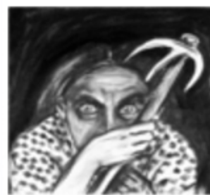
Triptychon "Selbst als Gärtnerin!", , sibirische Kreide