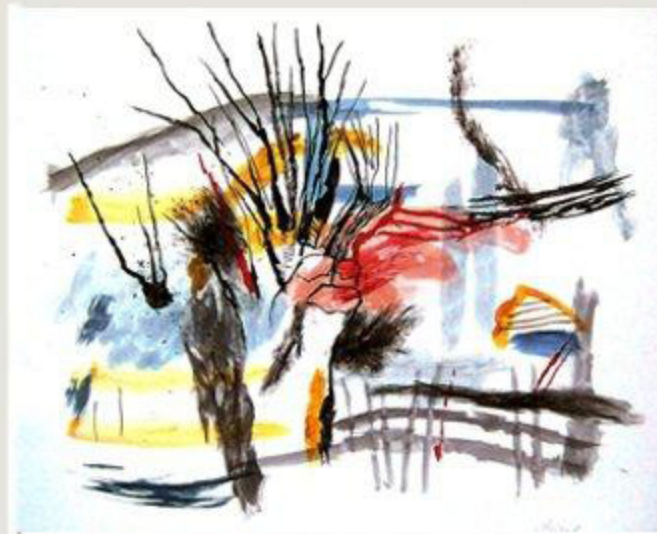
"Landschaft mit Wald", 2011

02.03.1953 in Zwickau geboren 1976-78 Assistentin an der Tu-Dresden, Sektion Architektur 1978-83 Studium der Malerei/Grafik Hochschule für Bildende Künste Dresden, Diplom 1989 Gründungsmitglied der „Dresdner Sezession 89“ 1996 Förderpreis der Landeshauptstadt Dresden (Sez.) 2001 Vorstandsmitglied / Künstlerbund Dresden Ausstellungen im In – und Ausland