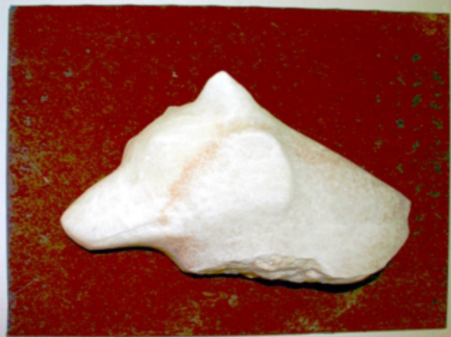
"Wolf", , Alabaster auf Eisen

1958 geboren in Dippoldiswalde 1982-88 Studium Bildhauerei an der Hochschule für Bildende Künste Dresden bei Helmut Heinze lebt und arbeitet in Karsdorf und Dresden