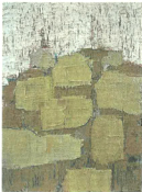
Talia Benabu, Öl und Steinschlamm auf Leinwand.

Als Talia Benabu sich entschloss, nach Deutschland zu kommen, war sie der Sprache nicht mächtig. Sie verlor sich im Augenstra, ganz unvoreingenommen, und entdeckte pinkelarbene Wälder. Die deutsche Sprache nur allmählich, spielte sie mit Buchstabenreihen aus Büchern, zerschneidete diese und entwickelte Streifen Collagen. Wälder aus Schrittwischen. Dass sie eine sensible, präzise Beobachterin ist, zeigen die Skizzen von Tanzenden, in denen die körperhafte Bewegung so zart in einem Verfließen angedeutet ist. Sie liebt Monotypien, zerschneidet diese und entwickelt daraus Collagen, die an Illusionsarrangements erinnern könnten.