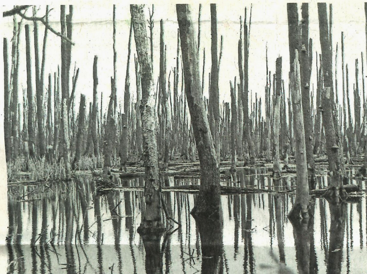
Gabriele Seitz: Anklamer Stadtbruch 2, 2015, SW-Fotografie auf Leinwand

Die Künstlerinnen beobachteten Seeadler, befanden sich inmitten eines Vogelparadieses, be-